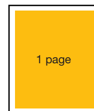
6" (L) X 7" (H)